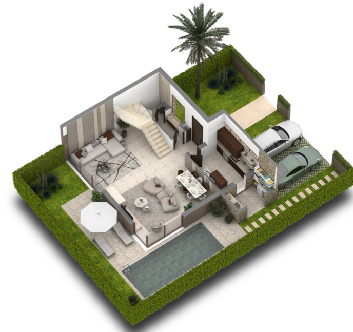
PLAN REZ DE CHAUSSEE