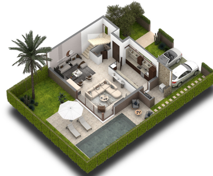
PLAN REZ DE CHAUSÉE