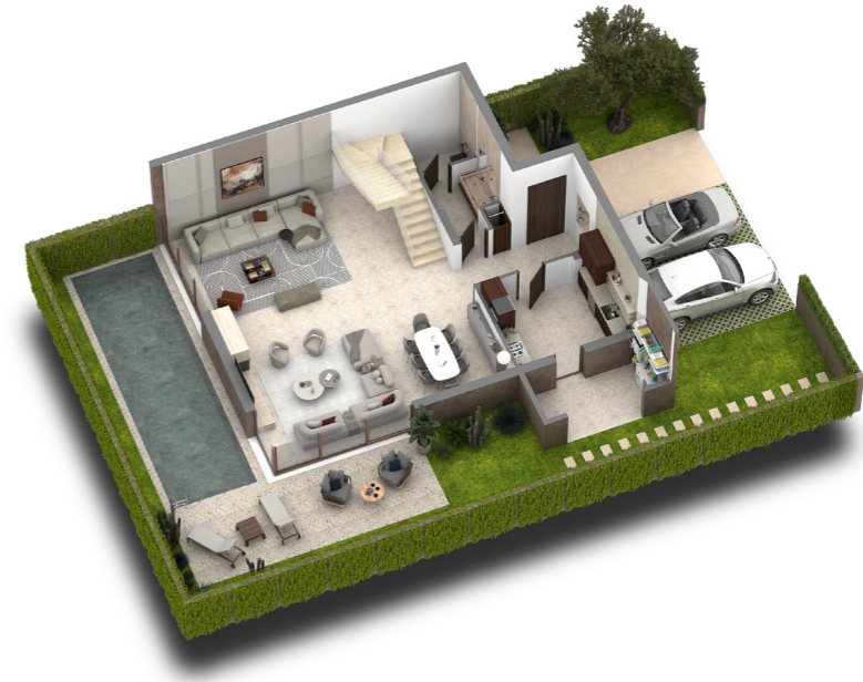
PLAN REZ DE CHAUSSEE