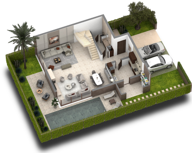
PLAN REZ DE CHAUSSEE